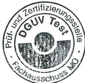
Unterschrift (Dipl.-Ing. Roland Knopp)