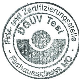
Unterschrift (Dipl.-Ing. Roland Knopp)